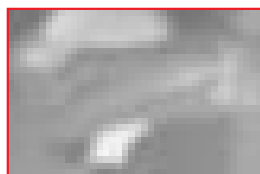
320 x 240 pixels: detail